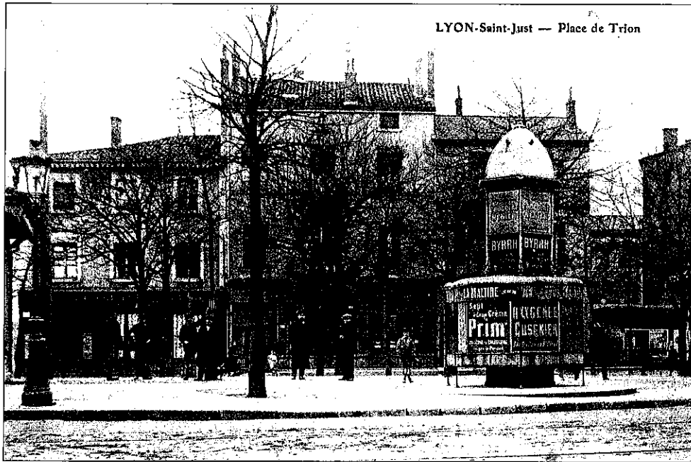
Fig. 89 : Côté sud-ouest de la place de Trion au début du XX e siècle, au centre la maison du n° 5.