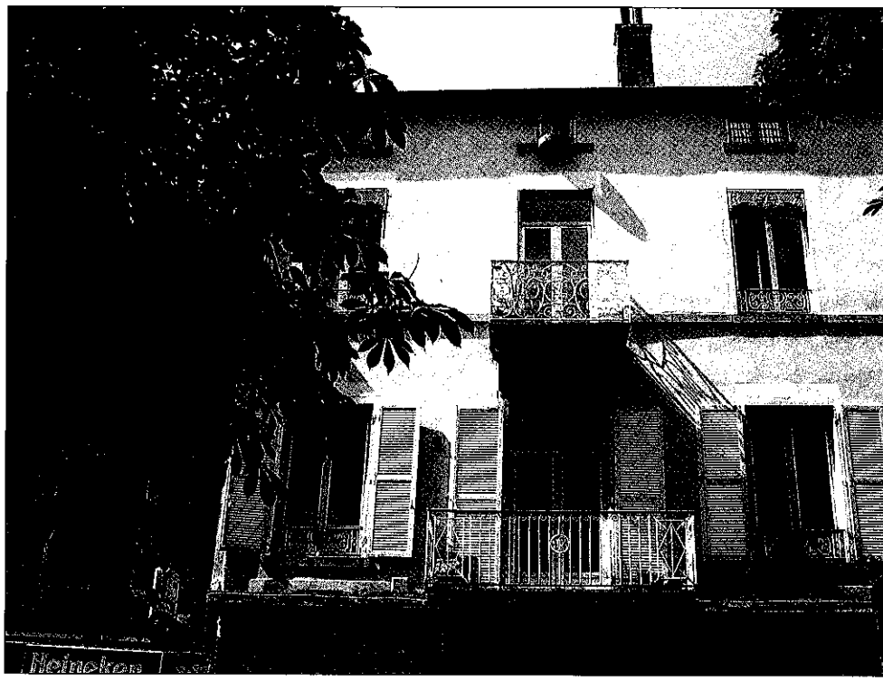
Fig. 90 : La maison habitée (et sans doute bâtie) par Jean Clément.